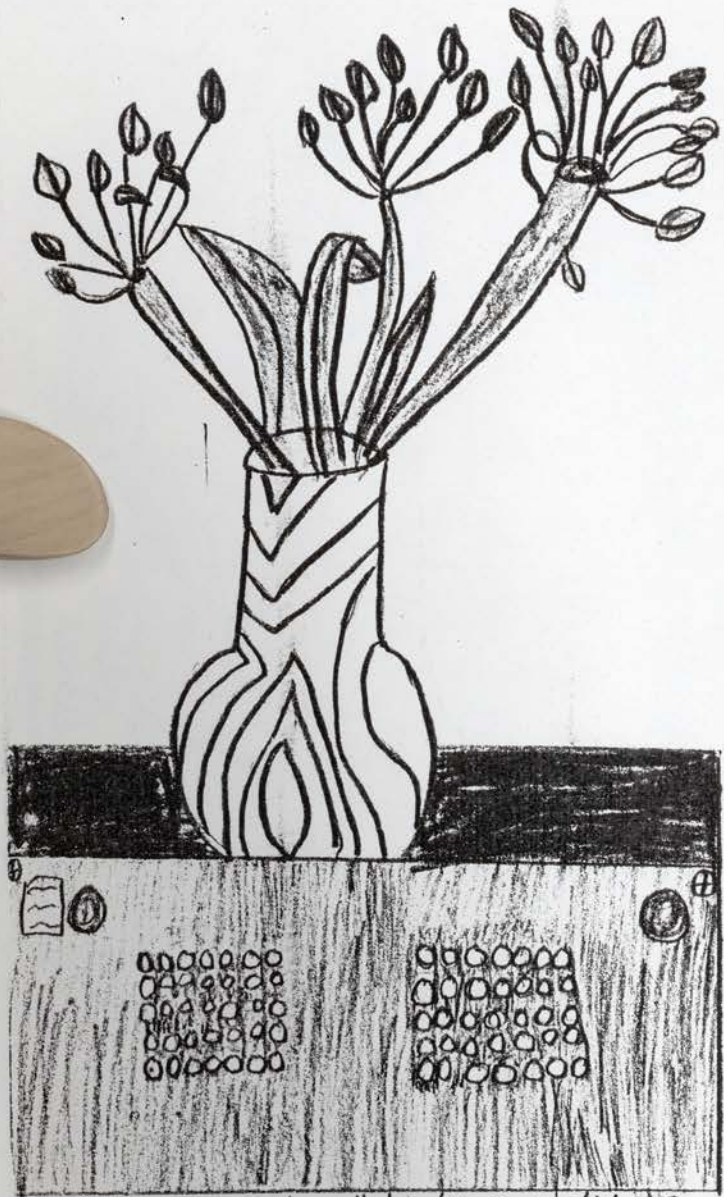
このえは日本、でずがのじかんにかいたえです。

わたしはなつやすみに日本へいきました。おにいちゃんといきました。日本であついですね。日本であせもがわたしのからだにいっばいできました。トウキョウのデイズニerlandにいきました。デイズニerlandでスペースマウンテンとマジックカーペットとかのりました。いっばいの人にならうんでいたけどおもしろかった。トウキョウの学校にはいりました。日本の学校は、わたしにはちよつとむずかしかった。こくごとリかがむずかしかった。日本は、学校でギョウしよくがあります。カナダの学校はギョウしよくがでないです。日本のギョウしよくはつくておいしくないます。カナダのギョウしよくのほうが、おいしいです。日本は、たのしかった。また日本にいきたい。